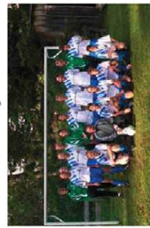
Mehrkampfmannschaft der Fußballmannschaft 2007

Wie schon zu Beginn des Vereinslebens wurden auch nach 1990 die Aktivitäten über den Fußball hinaus ausgeweitet. So wurde - wie bereits im Winter 1984 - neuerlich 1992 in Laibach ein Bezirksrobberrennen durch die SPG veranstaltet. Auch die Organisation von Vereins- und Vereinsobberrennen, Radwandertagen, gemeinsamen Wanderungen, diversen Mehrkämpfen oder Kinderspielfesten standen in den vergangenen Jahren auf dem Programm. Mit großem Einsatz wurden zu Beginn besonders die Kinderschiennen durchgeführt. Diese fanden nämlich nicht etwa auf präparierten Rsten hoch oben am Berg, sondern in den Weitem direkt bei der Bevölkerung statt. So erinnern wir uns heute noch gerne an Rennen in Gröb, dem „Plaffenloch“ oder in Rifonal, wo vor dem Rennen erst die Rste „getreten“ werden mussten.